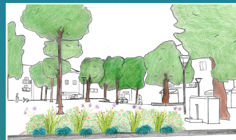
APRÈS - Illustration non contractuelle de l'aménagement envisagé place Léopold Ollier

Le mégot de cigarette : un déchet dangereux et polluant !