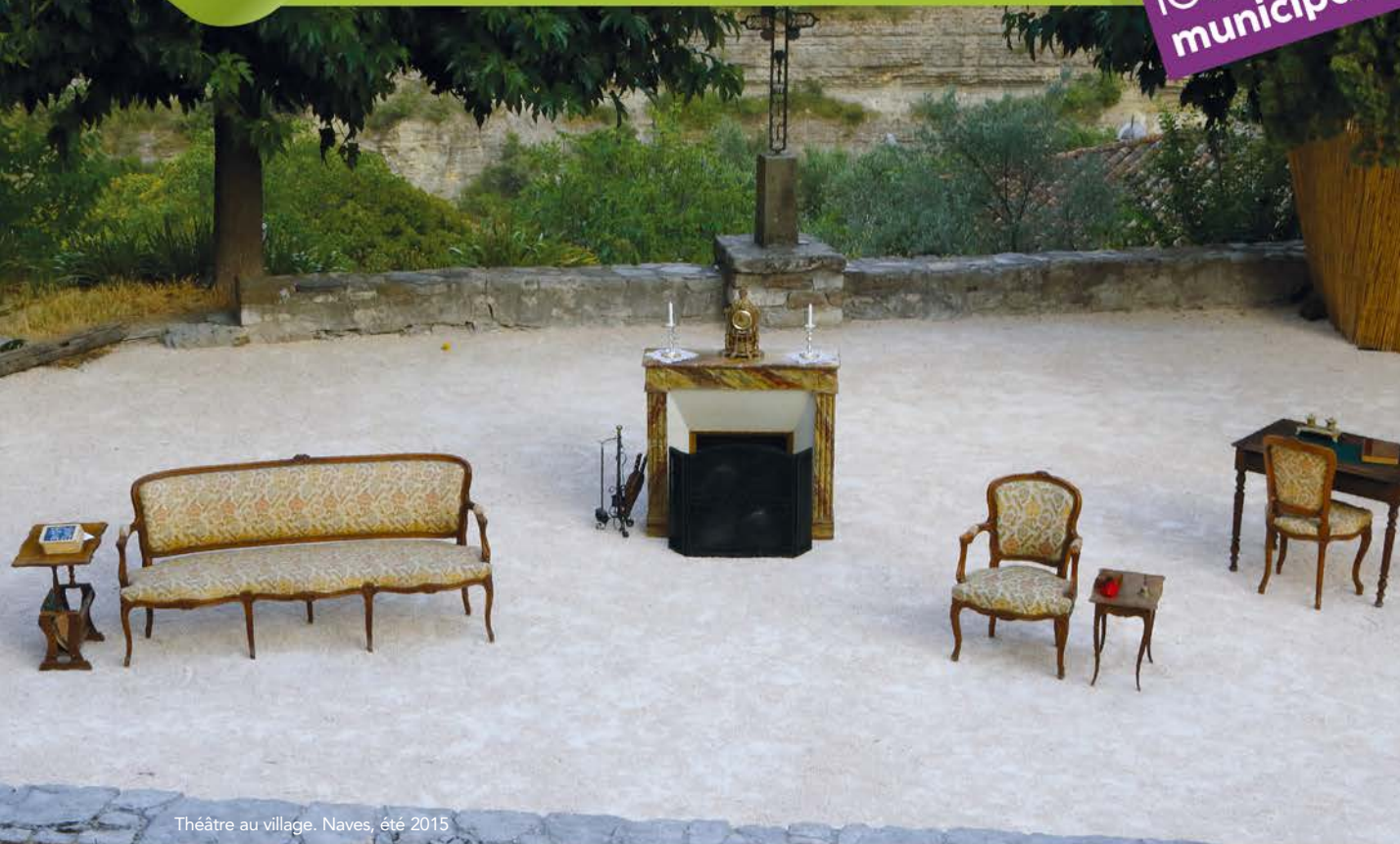
Théâtre au village. Naves, été 2015