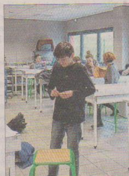
Au rallye des sciences.